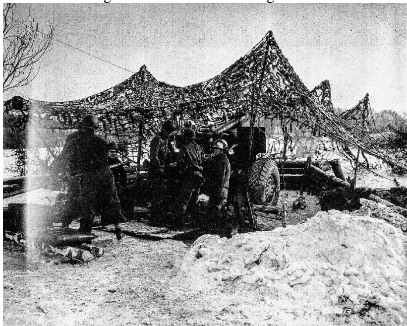
Ein 155 mm Feldartillerie-Bataillon ist einsatzbereit irgendwo in Roetgen, 1944

gesichert habe und alles so weit in Ordnung sei; dass er aber der Kommandantur weißen und roten Stoff habe verkaufen müssen. Dann stellte sie bei Direktor Souvignier fest, dass wirklich alles so geschehen sei und er sich mit darum kümmern wolle. Später trat sie dann mit Schwester Oberin den Rückmarsch bis Walheim an, auch wieder ohne Behelligung. Vom Walheimer Kloster aus wurde sie mit einer ausgetauschten Schwester und einem alten, für das Roetgener Krankenhaus bestimmten Frauchen durch das Auto eines Feldgeistlichen wieder zurückgebracht.