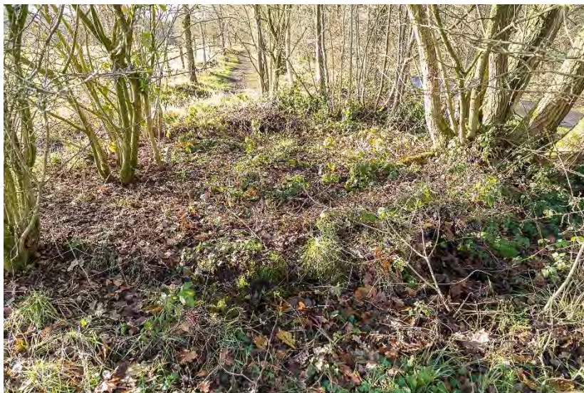
Die kreisförmige Silhouette des Turmfundaments, 2020

bekannt. Eines der abgeschossenen Flugzeuge stürzte 1944 in ein Haus auf Petergensfeld; die Überreste wurden später geborgen. 9 Laut Zeitzeugen wurden damals mindesten zwei P-47D abgeschossen. Die 2. Maschine ging auf dem Struffelt nieder. Von den herbeigeilten Neugierigen wurde angeblich beobachtet, dass der Pilot auf Struffelt den Absturz oder die Notlandung überlebte und dann von den Amerikanern erschossen wurde. 10 Der Hintergrund der Geschichte ist, dass die Amerikaner damals glaubten, es mit deutschen Soldaten in amerikanischen Uniformen und erbeuteten amerikanischen Flugzeugen zu tun zu haben. Da die US Army offensichtlich 1944 nicht in der Lage war, mit ihrer Luftunterstützung per Funk zu kommunizieren, war der Boden für solche Vorfälle natürlich perfekt vorbereitet. Offiziell hat man bisher nie etwas über diesen Vorfall erfahren.