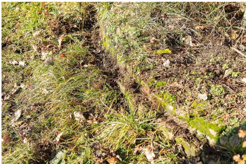
Im Gras findet man Reste des kreisförmigen Turmfundaments, 2020.

Auf einer modernen Schummerung-Karte findet man leicht die Stelle, wo früher einmal der Wasserturm gestanden hat. Wir haben uns dann aufgemacht und nach Resten des Gebäudes gesucht. Der Fahrweg, der früher einmal zum Turm führte, ist längst verschwunden. 7 Stattdessen führt heute östlich des RA-VEl Radwegs ein Fußpfad dort vorbei. Kurz vor dem Wanderastplatz am „Honigsack“ 8 findet man dann tatsächlich die Überreste des Turmfundaments.