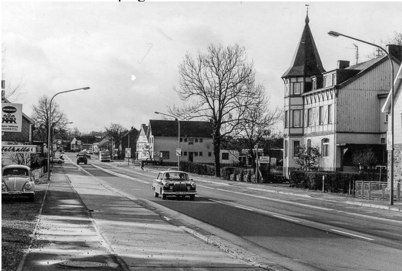
Das Ortsbild an der B258 um 1968, Blick in Richtung Monschau

Für den Heimat- und Geschichtsverein ist dies ein Thema, das schon seit der Vereinsgründung unsere Mitglieder in großer Zahl „umtreibt!“. Beredtes Beispiel für das Interesse der Roetgener Bevölkerung am Erscheinungsbild ihres Ortes war 2014 die Aufregung um den Abriss einer der wenigen Gründerzeitvillen, des „Türmchenhauses“ auf der Bundesstraße. Es genügten wenige Zeitungsartikel, um fast einen Aufstand anzuzetteln. Im Endeffekt hat das aber den Gang der Dinge nur wenig beeinflusst: Die Gemeindeverwaltung regte sich damals über ein paar umgelegte Buchen an der B258 mehr auf als um das endgültige Verschwinden dieses ortsbildprägenden Gebäudes.