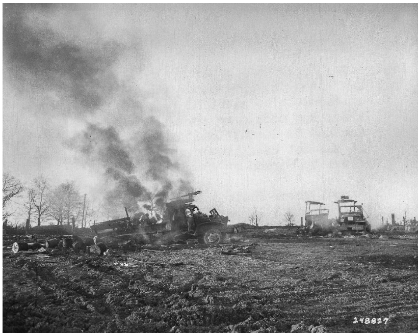
Die Zerstörungen am 26. Dez. 1944 aus der Nähe

des Lokomobile-Schuppens der ehemaligen Genossenschaftsweberei. Kurz hinter dem Bahnhof auf der Anhöhe brennen die amerikanischen Stellungen. Rechts daneben sieht man an der Bahnstrecke einen Turm, der große Ähnlichkeit mit den Wassertürmen hat, die damals die Wasservorräte für die Lokomotiv-tankstellen an den Bahnhöfen bevorrateten. Da der Wasserturm für den Roetgener Bahnhof aber auf dem Bahnhof neben dem Bahnhofsgebäude stand, konnten wir uns „keinen Reim“ auf das Bild machen. Erst auf weitere Nachfragen erhielten wir von dem Zeitzeugen Rainer Küsgens die Information, dass hinter dem Bahnhof tatsächlich noch ein weiterer Wasserturm gestanden hat.