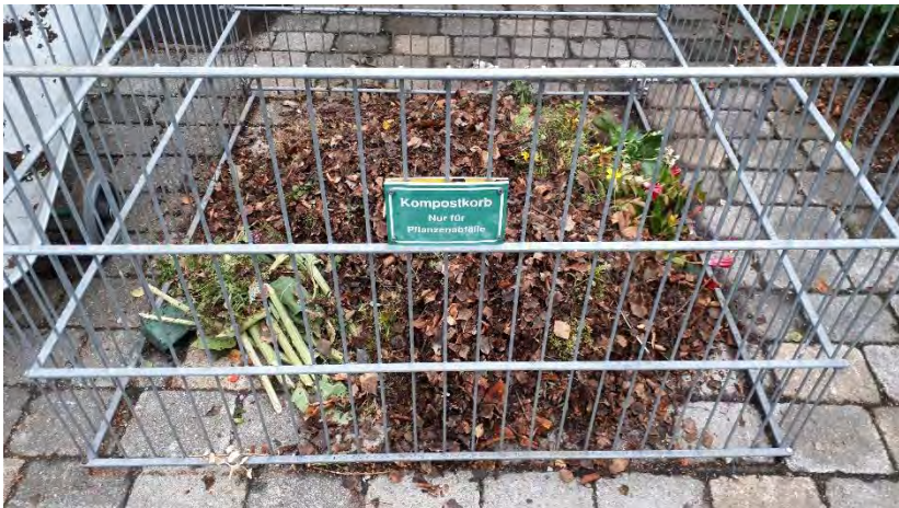
Grünabfälle auf dem Friedhof

Während in der „Menschenwelt“ eine Neuigkeit die andere jagt, läuft in den Böden immer alles gleich vor sich hin: Das Laub rotet, die abgestorbenen Pflanzenteile faulen und werden von Pilzen und Bakterien verzehrt. Die Letzteren werden von größeren Bodenlebewesen (wie z.B. Regenwürmern und Asseln) gefressen und der Kreislauf der Nährstoffe geht immer weiter. In der Natur gibt es keinen „Grünabfall“ – alles stellt Nahrung für jemanden dar. Nur die Menschen mögen keine abgestorbenen Pflanzen sehen und schon gar nicht auf ihren Beeten oder den gepflegten Begräbnisstätten. Durch den dortigen permanenten Wechsel der blumigen Dekorationen entstehen viele „Grünabfälle“, die teuer sind und weit abtransportiert werden müssen. Dabei könnten sie so einfach lokal verwertet werden!