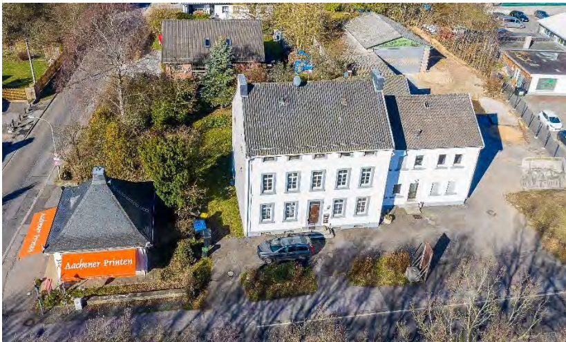
Haus „Vennblick“, an der Einmündung der Raerener Straße in die B258 gelegen, Foto 2019.

Das Haus „Vennblick“, mit der Adresse Bundesstraße 16, 52159 Roetgen, wurde am 7. April 1987 in die Denkmalschutzliste der Gemeinde Roetgen unter Nr. 43 eingetragen. Es ist zweifellos eines der ortsbildprägenden Gebäude am Ortsausgang nach Aachen, an der linken Seite der B258 gelegen. Es handelt sich um ein 2½-geschossiges, fünfsichtiges Gebäude, das etwa in der Mitte des 19. Jh. als Wohnhaus errichtet wurde.