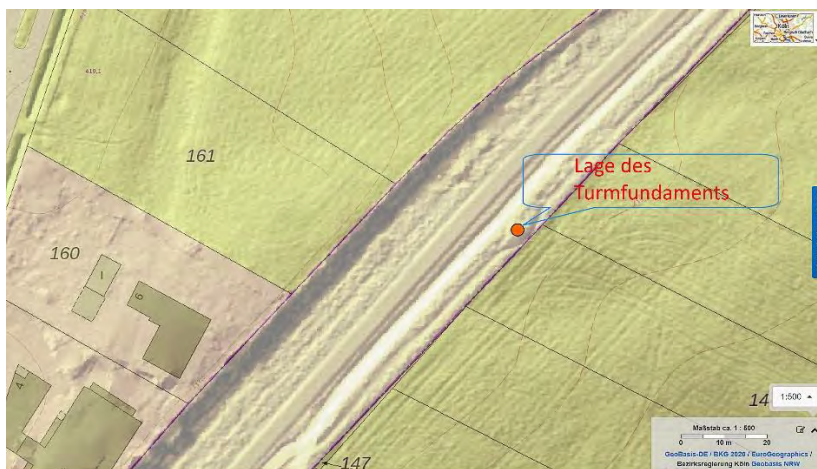
Die Stelle, wo früher der Wasserturm stand, 2020.

Wir fanden heraus, dass die Anlage, zu der auch der gezeigte Wasserturm gehörte, eine interessante Geschichte hat: Sie beginnt schon im 19. Jh., als die preußische Eisenbahnverwaltung an der Oberweser eine kleine Talsperre 5 bauen ließ, um die Lokomotiven der Vennbahn mit Wasser zu versorgen. Nach einem privaten Abkommen zwischen der Bahnverwaltung und der Stadt Eupen bekamen die Eupener vor dem 1. Weltkrieg regelmäßig Wasser aus dieser Talsperre für ihr Clouse-Wasserwerk. Nach dem 1. Weltkrieg, als u.a. die Vennbahn, Raeren und Eupen belgisch wurden, hörte das auf. 6 Die Wasserleitung für die Wasserversorgung des Roetgener Bahnhofs wurde stattdessen bis Raeren weitergeführt, um dort u.a. auch die Lokomotivtanksstellen zu versorgen; in Roetgen entstand unser Wasserturm kurz hinter dem Bahnhof in Richtung Raeren.