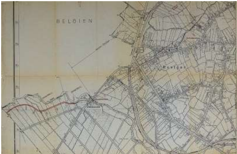
Übersichtskarte: Verlauf des Weserstollens 1

Viele kennen zwar im Zusammenhang mit der Dreilägerbachstalsperre den Kallstollen, aber nur Wenige wissen etwas über den sog. Weserstollen, der, bei Charliers Mühle beginnend, fast bis unter das derzeitige Ortszentrum verläuft.