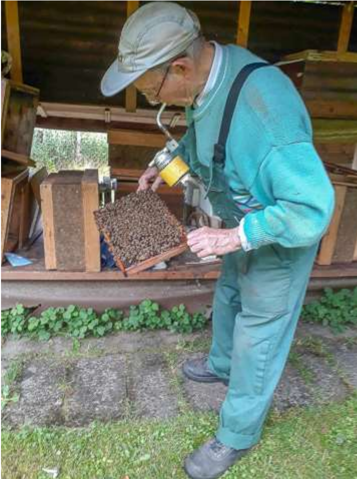
Bild 21: Der sanfte Rauch der Bienenpfeife beruhigt die Bienen und erleichtert somit dem Imker das wöchentliche Nachschauen der Waben.

Also hängt der Imker immer wieder zusätzliche Rähmchen in die Beuten und beschäftigt dadurch die Bienen mit Honigsammeln und Brutpflege, was wiederum auch den Bau von Weisel-