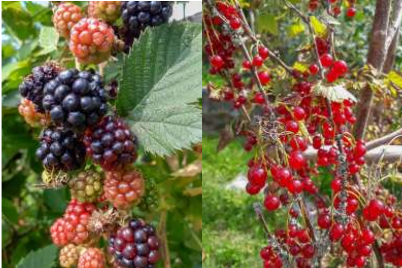
Bild 25 und 26: Brombeeren und Johannisbeeren Das Resultat der Bestäubung ist eine reiche Ernte.

Im April 2018 hat sich jedoch die EU mit knapper Mehrheit für ein Verbot von bienenschädlichen Neonikotinoiden entschieden. Außerdem will das Bundesumweltministerium, wie aus der Presse im Oktober 2018 zu lesen war, um das Insektensterben einzudämmen, 100 Millionen Euro für Insektenschutz bereitzustellen, davon 25 Millionen Euro für Forschung und Insektenmonitoring. Unter anderem soll die Anwendung von Pestiziden noch weiter eingeschränkt werden. Insofern besteht die Hoffnung, dass durch den Verzicht dieser Mittel in der Landwirtschaft es nicht so weit kommen wird, dass es hier im Laufe vieler Jahre kaum mehr Bienen und andere Insekten gibt. In Regionen Chinas ist das schon heute der Fall. Hier muss der Mensch nachhelfen. Da werden die Blüten der Obstbäume von chinesischen Arbeiterinnen mit Hilfe eines kleinen Pinsels aus Hühnerfedern mit Pollen bestäubt, um überhaupt einen Ertrag an Früchten zu erzielen.