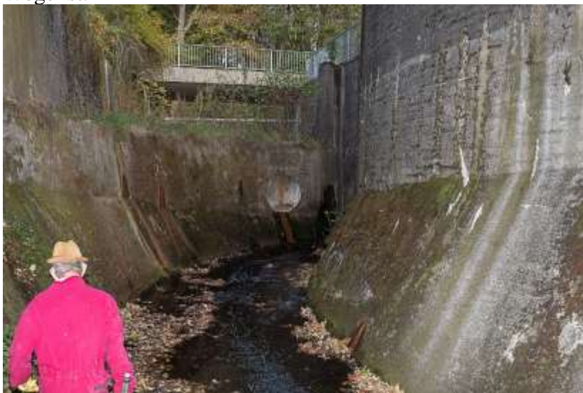
Ableitung der Weser an Charliers Mühle

Als vor 1850 die Roetgener Bäche noch in ihrem natürlichen Zustand waren, gab es drei Richtungen, in die das reichlich fallende Regenwasser abfließen konnte: 1. Die Bäche der Roetgener Mulde, mit dem Schleebach im Osten, dem zentralen Roetgenbach, der viele kleinere Gewässer des Dorfes zum Grölisbach im Nordwesten transportiert, verbinden sich schließlich zum Vichtbach, der im Norden das Dorf in Richtung Stolberg verlässt. 2. Der Dreilägerbach, der genauso wie der Schleebach im Südosten des Ortes seinen Ursprung hat, mündet aber durch ein Nebental ganz im Osten zwischen Struffelt und Fallheide ebenfalls in den Vichtbach. 3. Die Weser, die westlich von Hochscheid im Venn entspringt, fließt durch ein Nebental der Roetgener Mulde zwischen Pilgerborn und Schwerzfeld zunächst in Richtung Norden. An Charliers Mühle macht sie dann plötzlich einen Knick nach Westen, da die Anhöhe des Pissevenns im Wege ist.