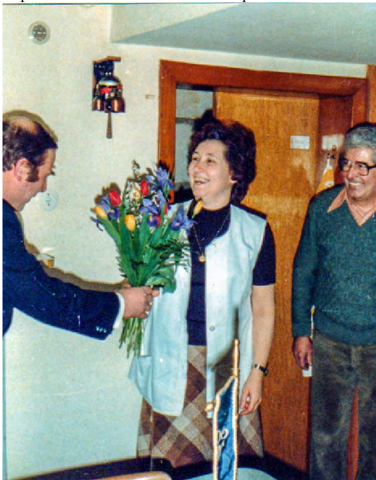
Blumen zur Einweihung der neuen Kegelbahn, 1980

Hier hatte unser Verein "Deck Dropp" seit 55 Jahren ein Zuhause. Da die Kegelbahn auf dem Hövel die einzige Sportstätte der Roetgener Keglerinnen und Kegler war, fand das gesellige und sportliche Beisammensein ein abruptes Ende.