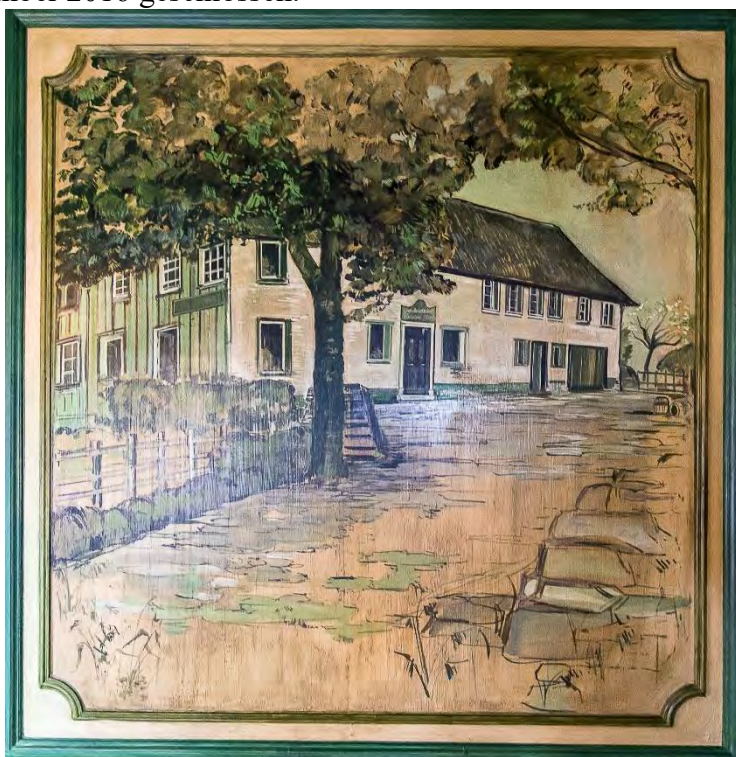
Wandbild im Restaurant „Zum Hövel“

Im November 2016 erhielten wir von unserem Wirt die Kündigung zur Benutzung der Kegelbahn. Das Restaurant "Zum Hövel", in dem wir seit Januar 1961 gekegelt hatten, wurde im November 2016 geschlossen.