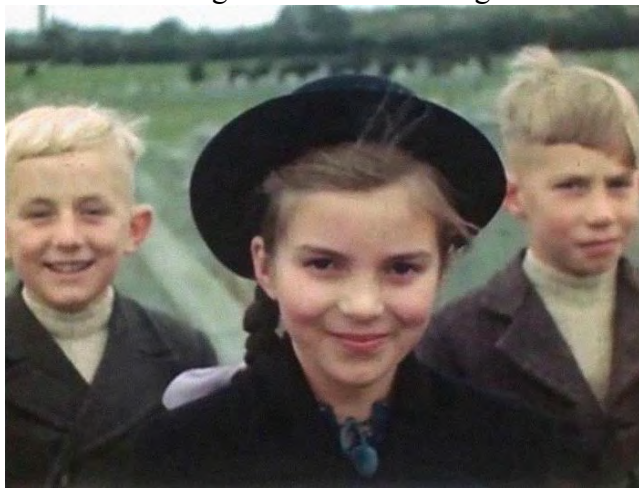
Deutsche Kinder, 1944

Halten wir uns aus heutiger Sicht lieber an die Feststellungen und Bewertungen der nach Roetgen vorgestoßenen GI's, die in Roetgen am 12. September 1944 der „Schlag“ traf, als sie feststellen mussten, dass ihre Propaganda bezüglich der deutschen Bevölkerung ziemlich falsch lag.