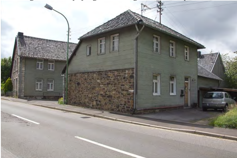
„Jeeßetempel“ Gesamtansicht, 2012 Roetgen, Hauptstraße

5 Die Rede ist von einer alten, giebelständigen 6 Winkelhofanlage in Roetgen auf der Hauptstraße Nr. 83-87. Sie ist unter Nr. 40 in die „Liste der Baudenkmäler“ in Roetgen eingetragen und wurde wahrscheinlich im 18. Jh. erbaut. 7 Dazu gehört auch das Haus Hauptstraße Nr. 89; laut Denkmalliste Nr. 35 ist es der ehemalige Wirtschaftsflügel des vorgenannten Hofes.