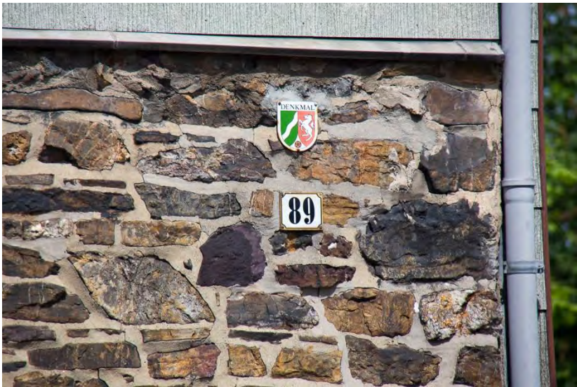
Hausnummer des Baudenkmal Nr. 35 in Roetgen