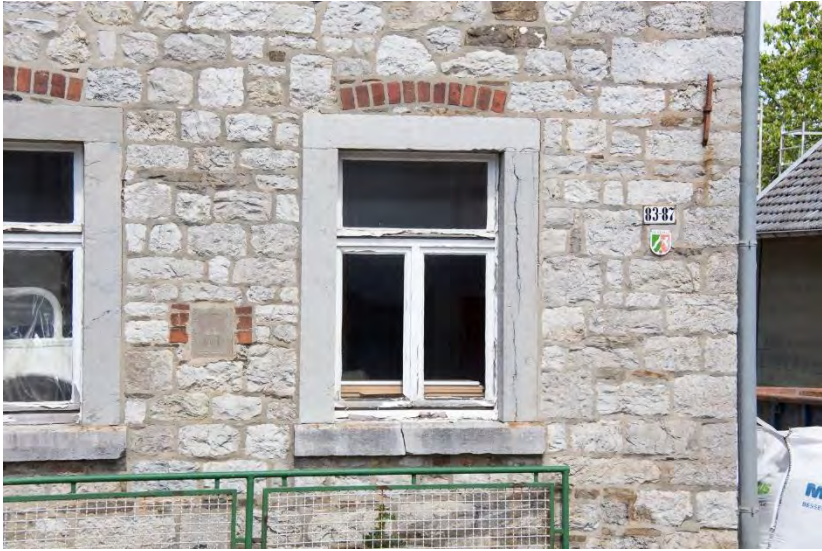
Blick auf den Giebel des Baudenkmal Nr. 40