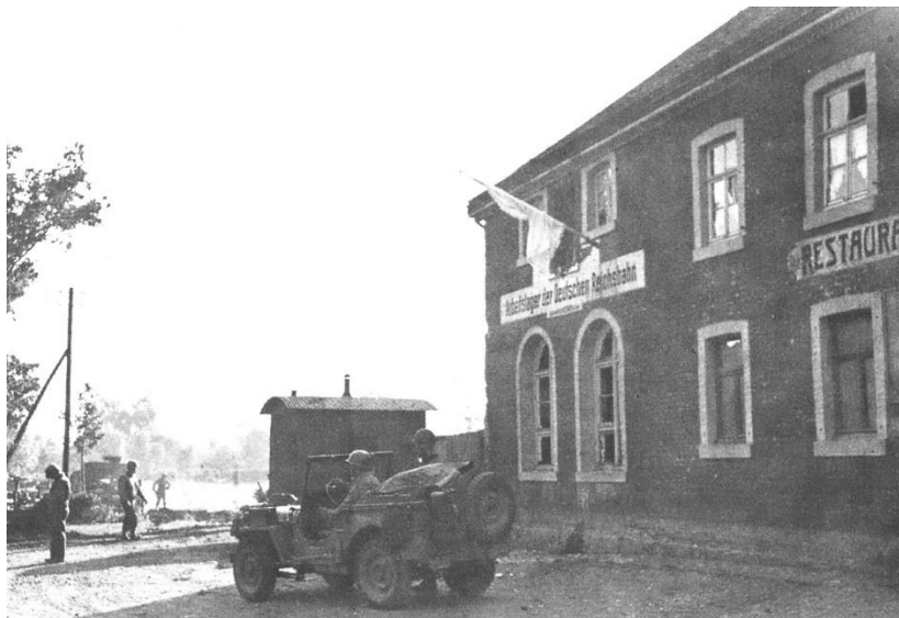
Arbeitslager und Restaurant an der Grenze zu Petergensfeld

„Ich befuhr mit meinem gepanzerten Fahrzeug die Mitte der Hauptstraße und fühlte mich betend wie auf einer Siegesparade auf einem Friedhof.“